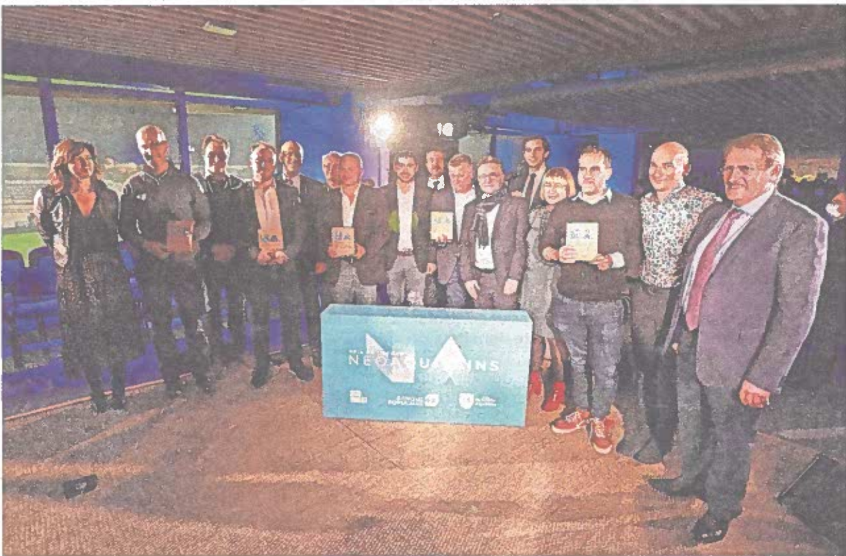
Les entreprises Insight, Netiful, Lesbats, Portalet et Massy ont été primées lors de cette cérémonie. PHILIPPE SALVAT