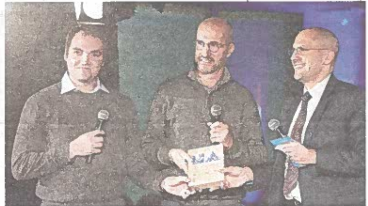
Lesbats a reçu le Prix départemental et représentera les Landes au concours régional. P.S.